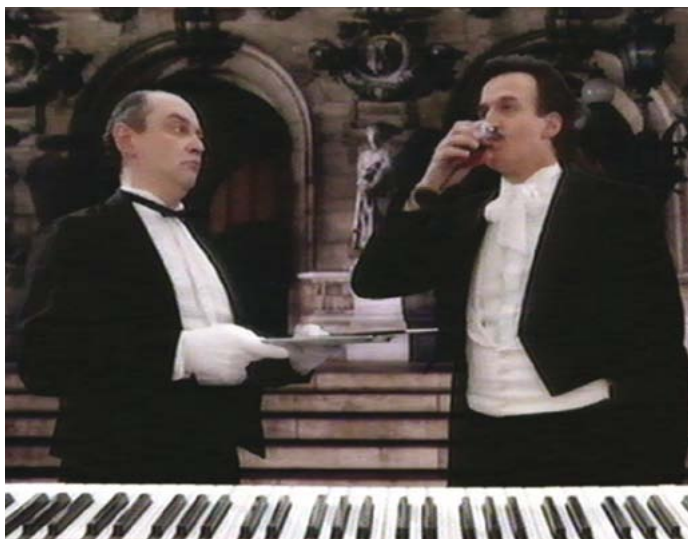
L'Orchestre de Zbigniew Rybczynski