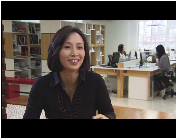
Jiang Qiong Er Créatrice de la maison de luxe Shang Xia