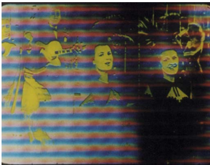
Synex and yours de Jeffrey Scher