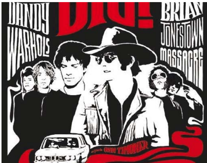
DIG ! de Ondi Timoner